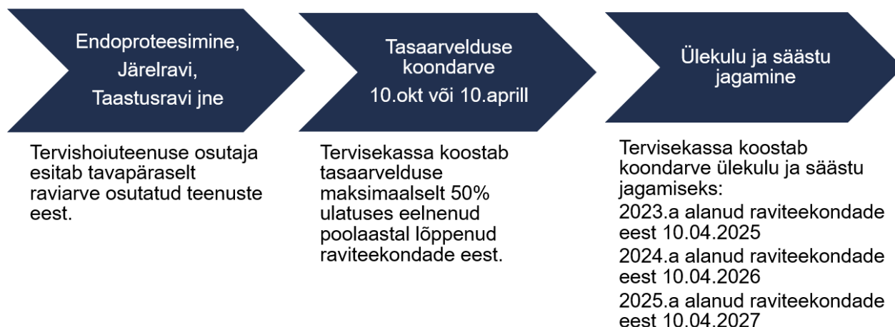
Joonis 1. Tasumise põhimõtted

5.7.3. Tervisekassa kohustub 2023.a III kvartali jooksul looma ja TTO-le kättesaadavaks tegema vajadustele vastava ja kooskõlastatud mõõdikute ning kulude jälgimise töölaua.