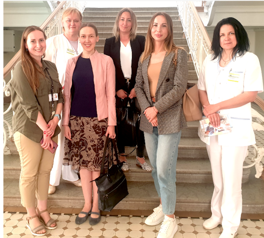
Rakvere Haigla ja Narva Haigla külastused juunis